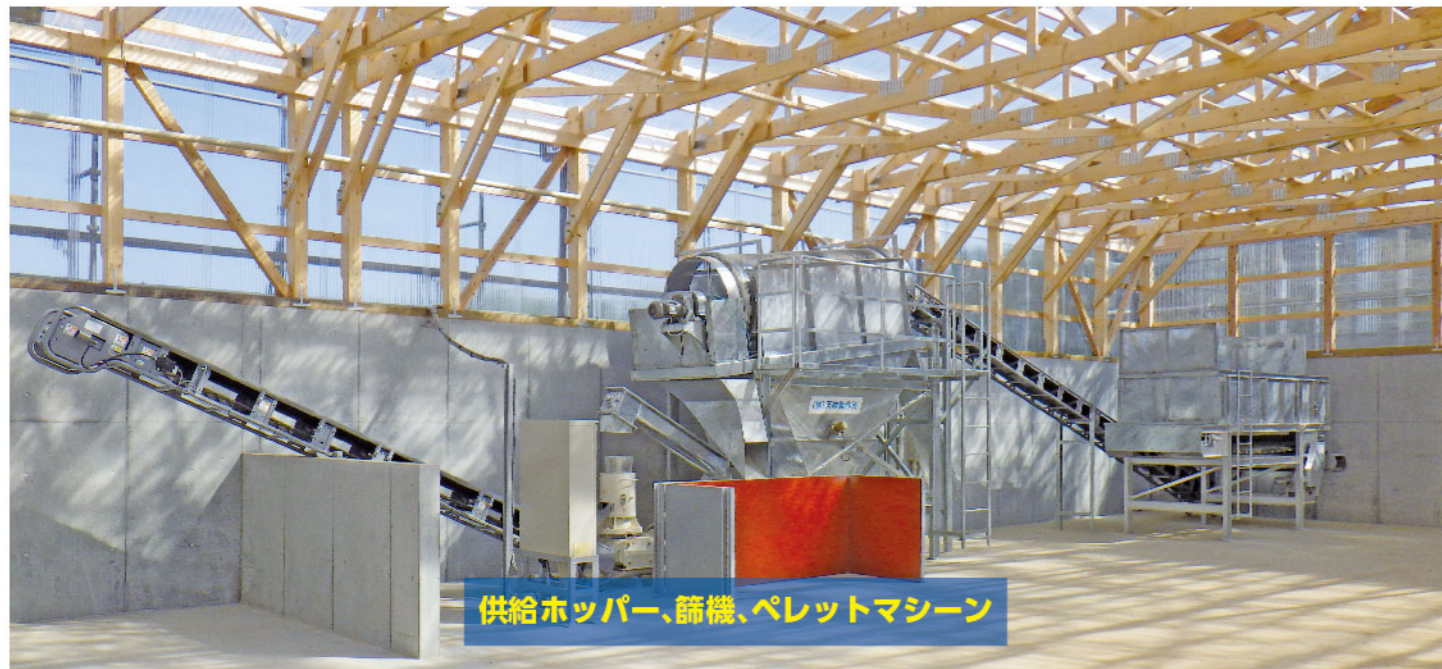
供給ホッパー、篩機、ペレットマシン