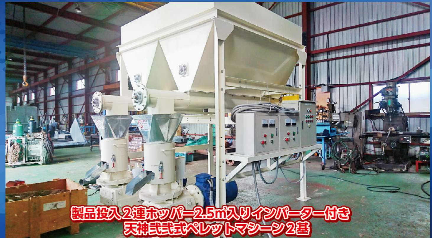
製品投入2連ホッパー-2.5m入りインバーター付き 天神式式式ペレットマシーン2基