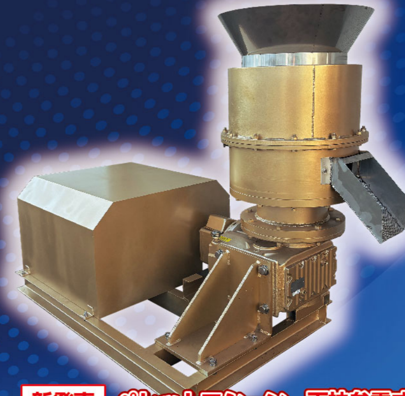
新発売 ペレットマシーン 天神参零式