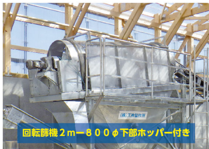
回転篩機 2m-800φ下部ホッパー付き