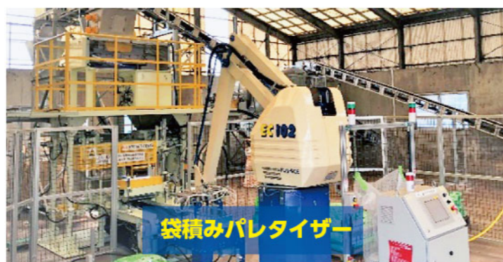
袋積みパレタイザー