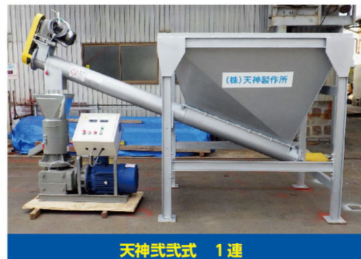
天神式 1連 1.5mホッパー付ペレットマシン