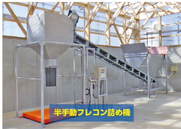
半自動フレコン詰め機