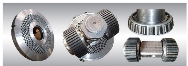
消耗品 ローラーとオリジナルダイスペレット