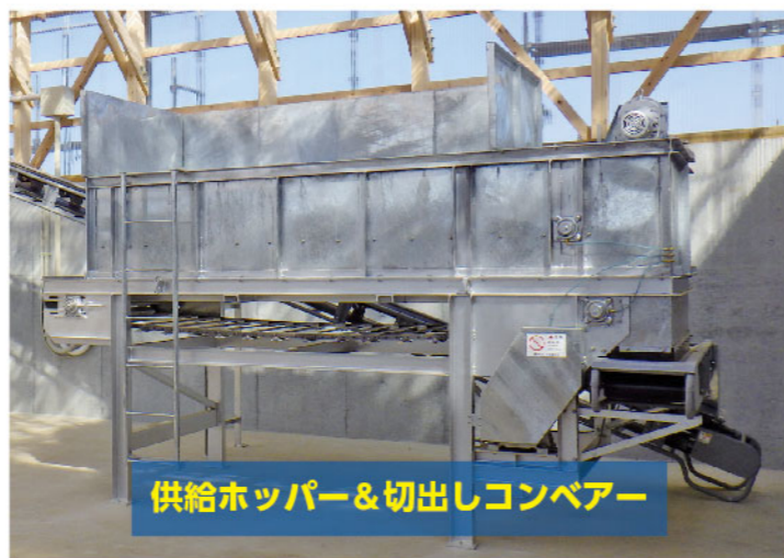
供給ホッパー&切出しコンベアー